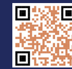
CARTA INVITACIÓN OFICIAL