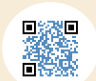
JJOO PARIS 2024