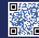
REQUISITOS DE INGRESO