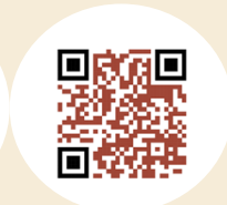
GUÍA DE VIAJE